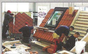
Munkában a szakmunkás tanulók / mesterek