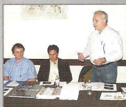
V. Szigetelő fórum – Ráckeve

Az Épületszigetelők, Tetőfedők és Bádogosok Magyarországi Szövetségének lapja