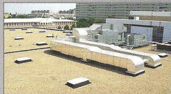
A nivódíjas lapostető – kivitelezője TECTUM Kft.