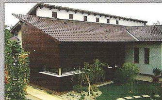
A nivódíjas magastető – kivitelezője KNITTEL Ács, Tetőfedő, Bádogos Vállalkozás